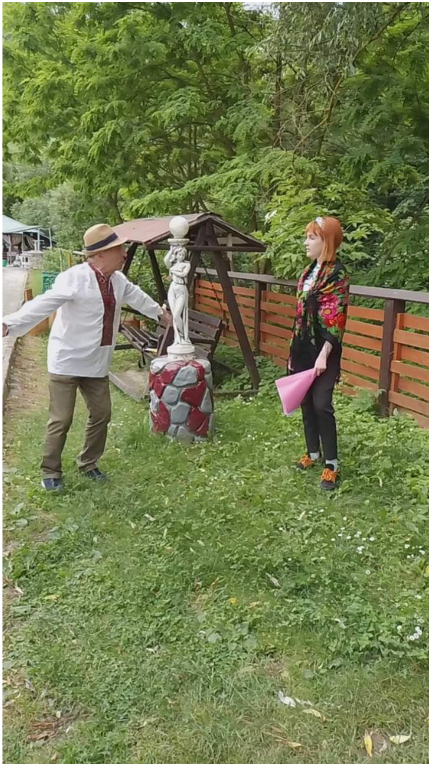
Інформація кафедри туризму та готельно-ресторанної справи

Загальні питання: centr@khnmu.edu.ua Публікація матеріалів: press@khnmu.edu.ua